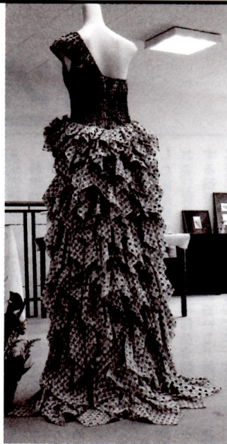
天草更紗で作ったドレス (文化服装学院連鎖校、ヒロ・デザイン専門学校)